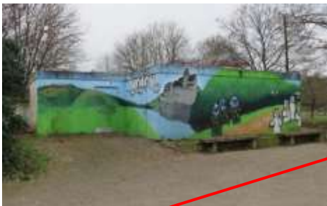
Toiletten Stadtbahnhaltestelle Hofen