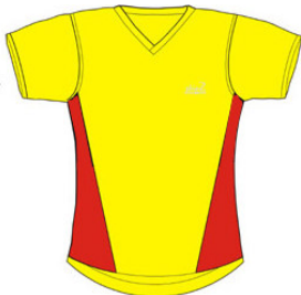
Vereinskleidung s. S. 32