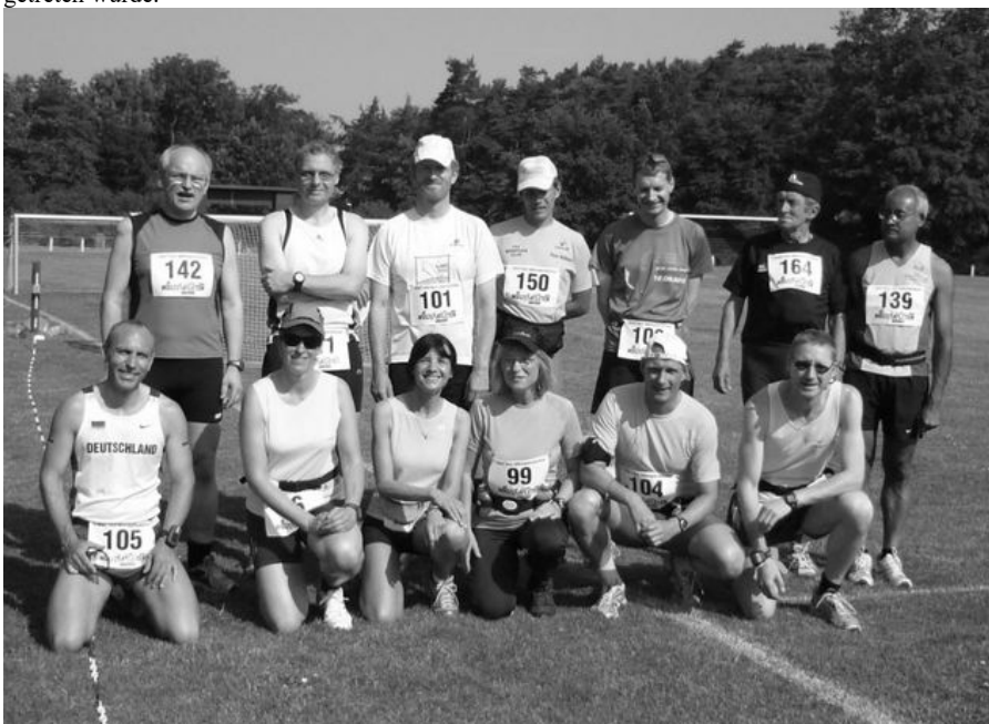
Alle deutschen Starter in Assens (Dänemark) am 3. Juli

Im November soll es noch eine Fahrgemeinschaft zum Marathon in Leens (Niederlande) geben. Der Marathon in Leens führt über 6 identische Runden und ist extrem flach aber auch sehr windanfällig. Kurz vor Weihnachten könnte es noch eine Fahrgemeinschaft zum dänischen Marathon in Grindstedt geben. Der Lauf ist auch recht flach und führt 5 Runden um einen See. Im vergangenen Jahr lag dort viel Schnee. Der diesjährige Termin der Veranstaltung ist zurzeit noch nicht bekannt.