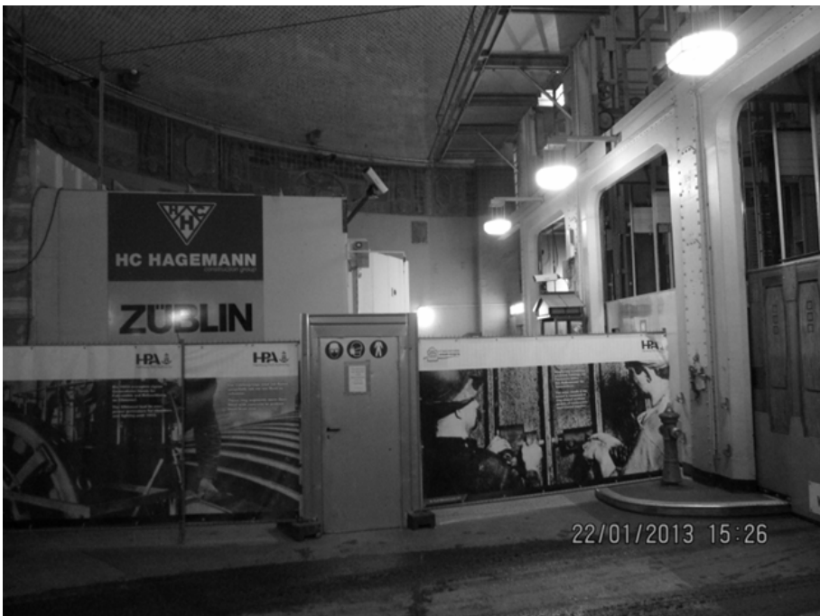
Zielbereich Steinwerder Seite

Wir haben ja noch die unverbindliche Zusage, dass wir in einem Zeitfenster zwischen Eröffnung der sanierten östlichen Röhre und Beginn der Sanierungsarbeiten an der Zweiten Röhre einen Marathon durchführen können. Wir wollen hoffen, dass die Bauarbeiten dies auch zulassen.