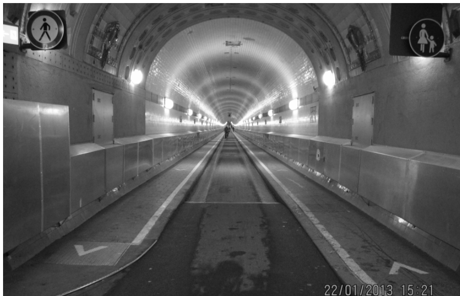
Die noch nicht sanierte westliche Röhre

Fußgänger: 750.000 Radfahrer: 100.000 Pkw: 120.000