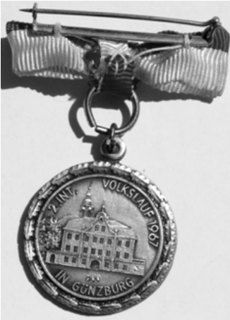
Silbermedaille Günzburg 1967

Die Geschichte der Finishermedaillen begann sicher mit den Volksläufen. So fand 1963 der erste Volkslauf der Bundesrepublik in Bobbingen bei Augsburg statt. Ich weiß nicht, ob bei die sem schon Finishermedaillen verteilt wurden, aber ich kann die Existenz solcher Medaillen immerhin bis ins Jahr 1966 zurück belegen. Damals wurden diese Medaillen sogar noch aus edlem Silber gefertigt, was heute wohl nirgendwo noch üblich ist.