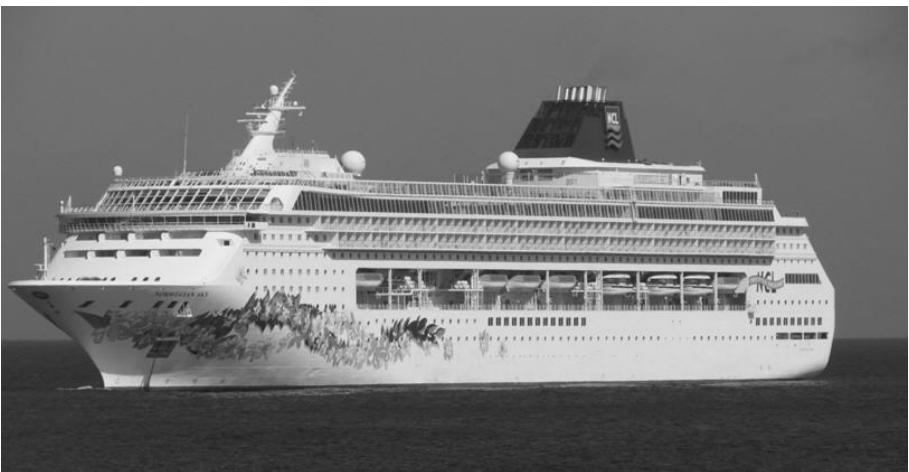
Die Laufstrecke der drei Cruise-Marathons – Deck 6 auf der Norwegian Sky. (Das Deck mit den Rettungsbooten).