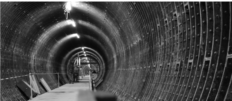
Die entkernte Oströhre

Seit 1994 wird der St. Pauli Elbtunnel in mehreren Bauabschnitten saniert. Von 1994 bis 1998 hat die Stadt das Betriebsgebäude erneuert. Im Anschluss wurden in zwei weiteren Projektabschnitten zunächst das Schachtgebäude auf der Steinwerde-Seite (1998 bis 2004) und der St. Pauli-Seite (2004 bis 2012) grundlegend instandgesetzt. Seit 2008 laufen bei der HPA die Planungen für die Sanierung der Tunnelröhren. Im August 2010 konnten die Arbeiten beginnen. Dabei kam es aufgrund des Alters und der Komplexität des Bauwerks immer wieder zu Verzögerungen. So mussten beispielsweise zusätzliche 12.000 Tonnen Ballaststeine auf den Tunnel gebracht werden, um einen Auftrieb des Tunnels während der Bauphase zu verhindern. Gleichzeitig sorgten erhöhte Bleiwerte in den Abbruchstäuben für einen zeitweiligen Baustopp.