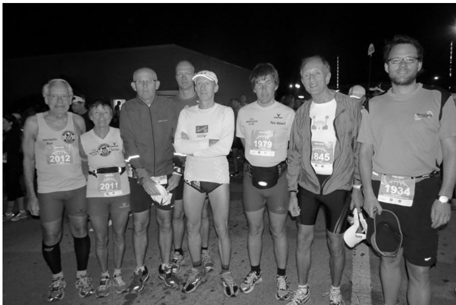
Die Starter und natürlich auch Finisher des Melbourne-Marathons:

Am Sonntag um 6:15 Uhr war dann der Start zu dem Musik-Marathon in Melbourne. Der Start ist in Florida immer in der Frühe wegen der zu erwartenden höheren Temperatur. Wir hatten jedoch Glück mit moderaten Temperaturen. Der Lauf führte zunächst an dem Indian-River entlang. Bei den Verpflegungsstationen gab es auch meist eine mehr oder weniger große Musikgruppe. Eindrucksvoll jedoch war der Klavierspieler an einem weißen Flügel auf der Spitze einer ca. 50 m hohen Brücke über den Indian-River, die gleichzeitig auch die Wendestrecke dieser ½ Marathon-Runde war, die doppelt gelaufen werden musste. Eine ebenso hohe Brücke gab es dann auch, nachdem wir durch private Wohngegenden mit den obligatorischen Musikgruppen gelaufen waren. Ziel-einlauf ging dann durch das „Altstadt-Viertel“, denn von Altstadt konnte man bei dieser noch recht jungen Stadt kaum reden. Für jeden Finisher gab es eine sehr große Medaille mit Abbildung einer dieser sehr hohen Brücken über den Indian-River. Abends saßen wir alle gemütlich in einem netten Abendlokal und unterhielten uns über die unvergesslichen Erlebnisse der vergangenen Tage.