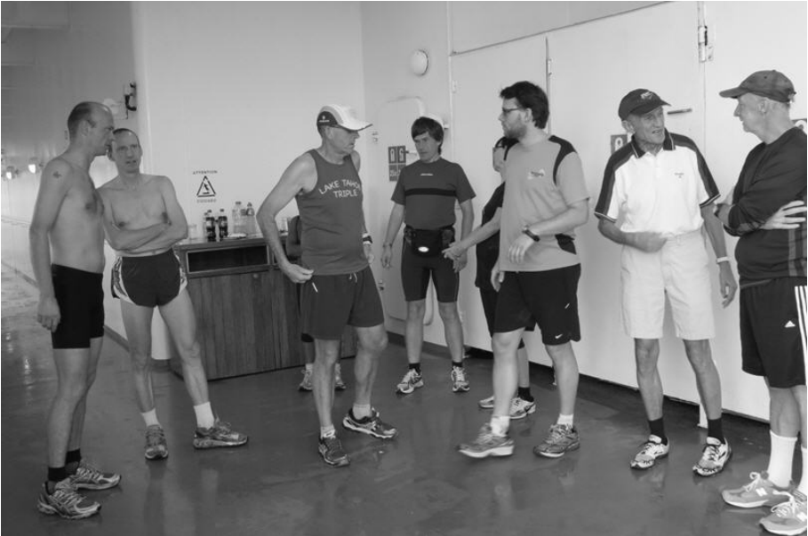
Aufstellung zum dritten „Cruise-Marathon“ – Mit den von Tag zu Tag steigenden Temperaturen wurde auch die Laufbekleidung immer spärlicher.

An den zwei weiteren Cruise-Marathons in Nassau und bzw. bei einer Privatinsel nahmen z.T. verletzungsbedingt nicht mehr alle Marathonis teil, dafür aber einige Kreuzfahrtgäste, die den Miami-Marathon mitgelaufen waren, von unserer Marathon-Serie hörten und jetzt auch versuchen wollten, einen weiteren Marathon innerhalb von wenigen Tagen zu laufen. Jedoch reichte es jeweils nur zu einem DNF, d.h. man muss für diese Mehrfachleistung schon ein rechter Profi sein.