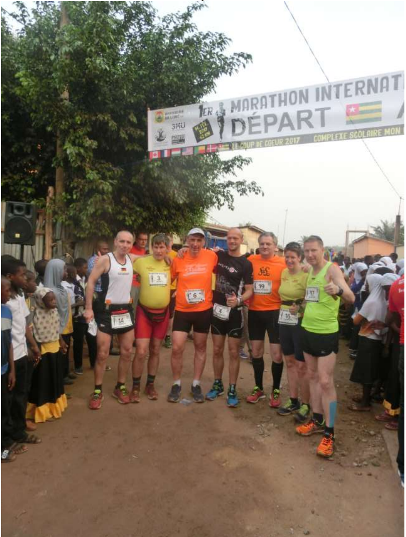
100 MC Reisegruppe vor dem Start in Parakou (Benin)