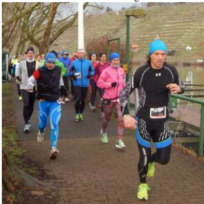
Kurz nach dem Start waren alle frisch: Ein Bild vom zweiten Marathon.

Weber ließ sich nicht abschrecken. Er hatte auch keinen Hochglanzlauf im Sinn, bei dem Kenianer und Äthiopier wetteifern. Ein Volkslauf „für einen kleinen Kreis sollte es werden“ – ohne Öffentlichkeitsarbeit. Am Neckar fand er eine Strecke. Los geht es beim