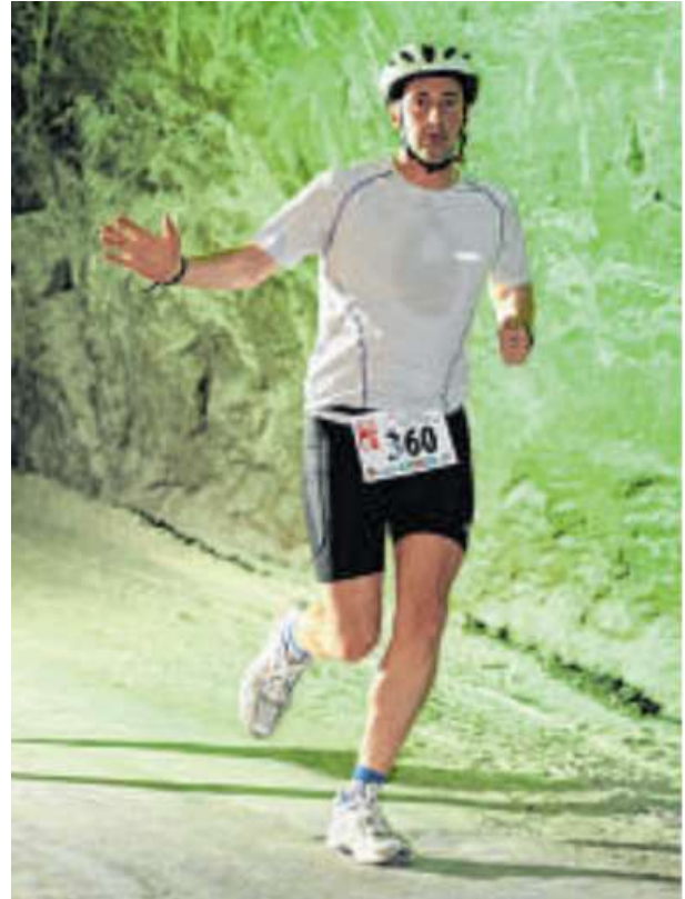
Marathon im Salzbergwerk Sondershausen 700 Meter unter der Erdoberfläche.

Kaum weniger lang, dafür aber mit 5412 Höhenmetern extrem anspruchsvoll und gefährlich war der „Zugspitz Ultratrail“ (2347 Teilnehmer aus 49 Nationen) über 101 Kilometer im Juni 2017. „Um 7.15 Uhr ging’s los. Der Sprecher hat uns am Start mit den Worten: ‚See you tomorrow‘ verabschiedet“, berichtet Stohldreier, der das Ziel nach 22:36,49 Stunden erreichte.