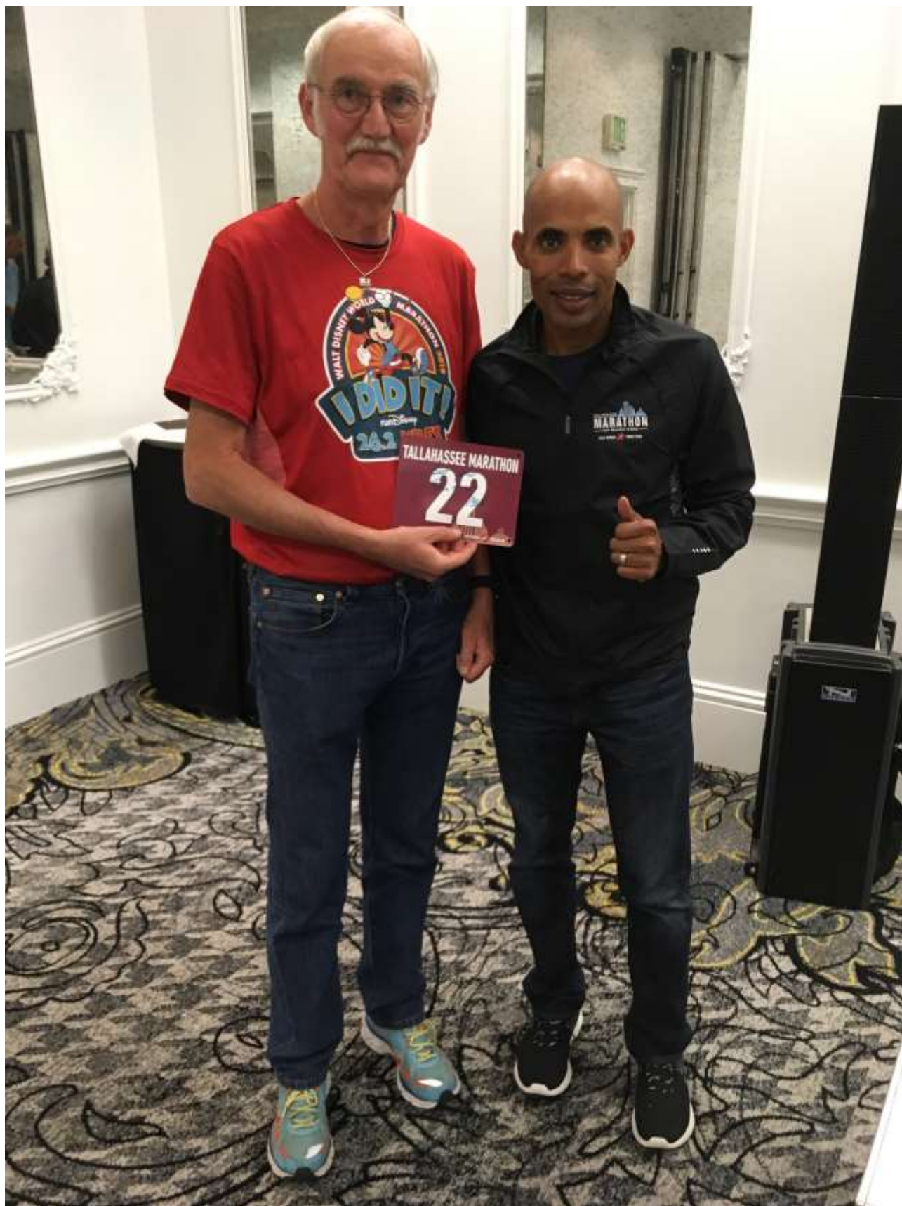
Vor dem Tallahassee Marathon hielt Meb einen sehr interessanten Vortrag und war zu vielen Gesprächen bereit. Auch ich konnte mich kurz mit ihm austauschen, erhielt sein Autogramm auf meiner Startnummer und natürlich gab es dann auch ein Foto. Eine tolle Erinnerung!