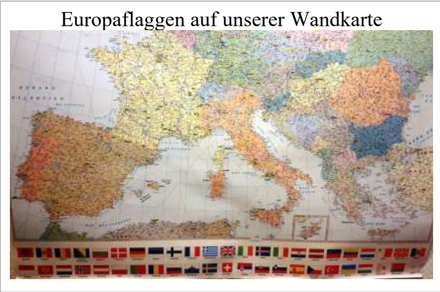
Europaflaggen auf unserer Wandkarte

wo laufen will und fährt auch hin oder fragt (später) nach, wie man da am besten hin kommt. Außerdem hatte sich eine Gruppe gebildet, die weiße (Marathon-) Flecken auf der europäischen Karte in Angriff nahm: so wurden marathonfreie Länder wie Albanien, San Marino und Gibraltar belaufen. Durch den Countryclub erfuhren wir, dass neben den 47 Staaten (die 46 auf unserer Europakarte abgebildeten plus Kosovo (unabhängig seit 2008), noch weitere 8 Länder gesammelt werden können, wie etwa Schottland, Isle of Man und die Färöer Inseln. Auf einmal bekam der Anruf von Horst Preisler aus dem Jahr 2011 Sinn, als er mir erklärte, warum die Kanalinseln Jersey und Guernsey als gesonderte Länder zu zählen sind. Es handelt sich um zwei der Zusatzpunkte, mit denen man in Summe 55 Zähler in Europa erreichen kann. Ein besonderer Grund noch einmal Gas zu geben, war die Brexit-Entscheidung der Briten. Als ich an jenem Morgen im Juni 2016 das Ergebnis im Radio hörte, stand für mich sofort fest, dass ich am nächsten ersten Montag im Mai den Belfast-Marathon laufen würde. So wurden für uns die britischen Flughäfen und -gesellschaften geläufiger und von 8 Ländern in 2017 hatten fünf etwas mit Großbri-