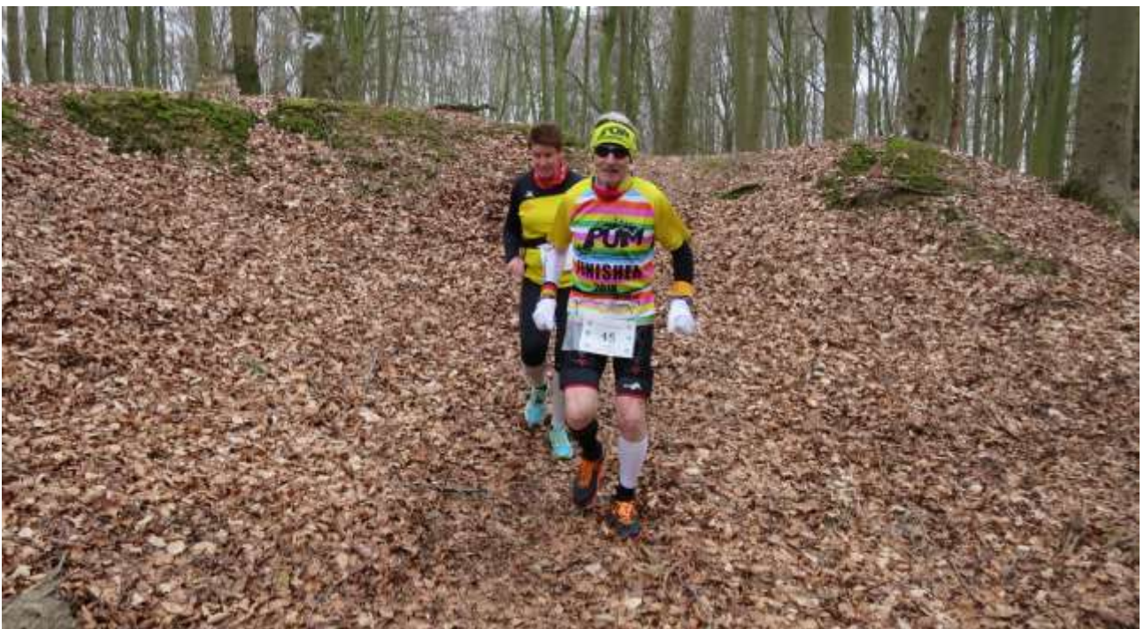
20 Jahre 100 Marathon Club Deutschland