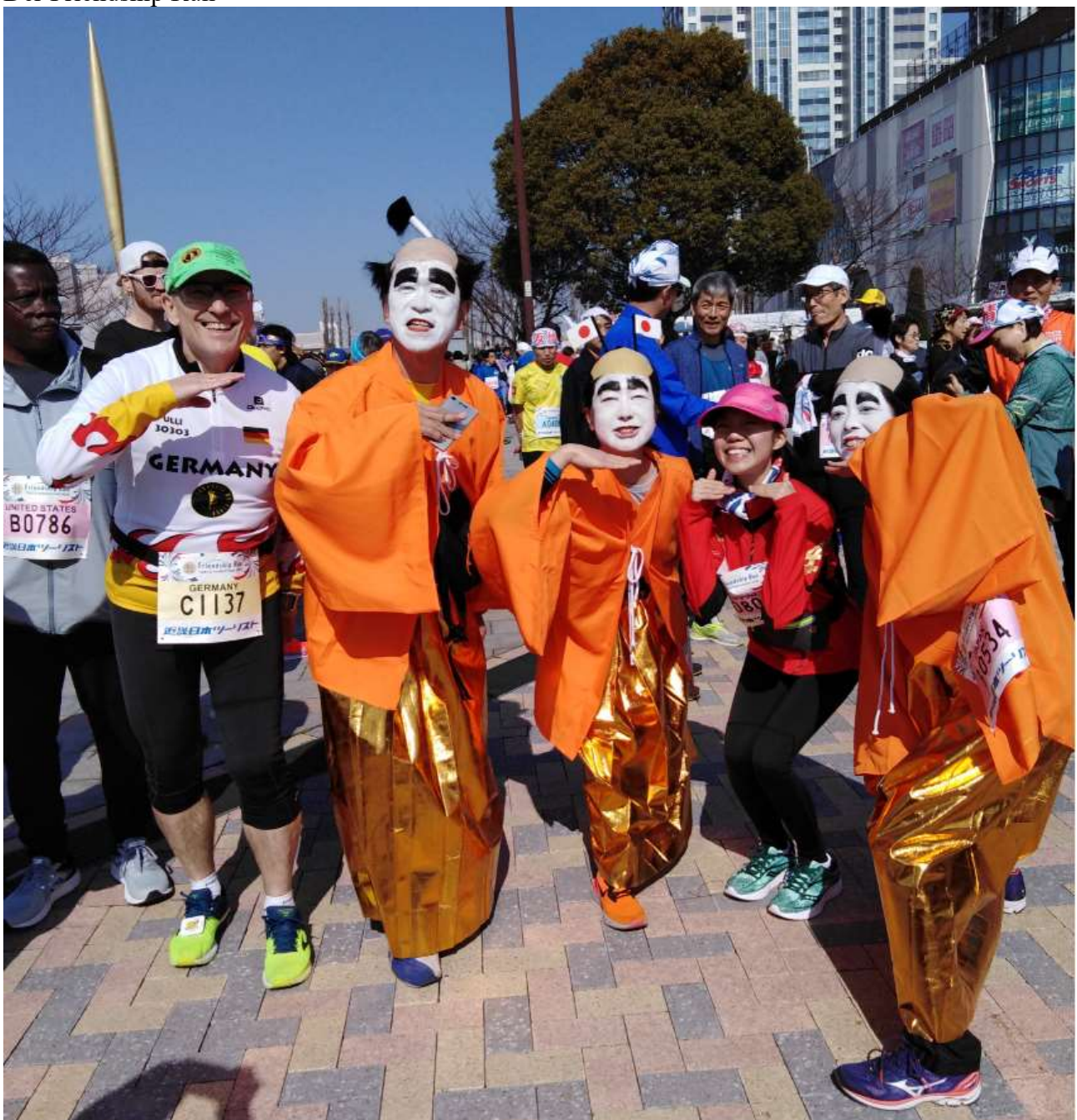
Friendship Run in Tokio