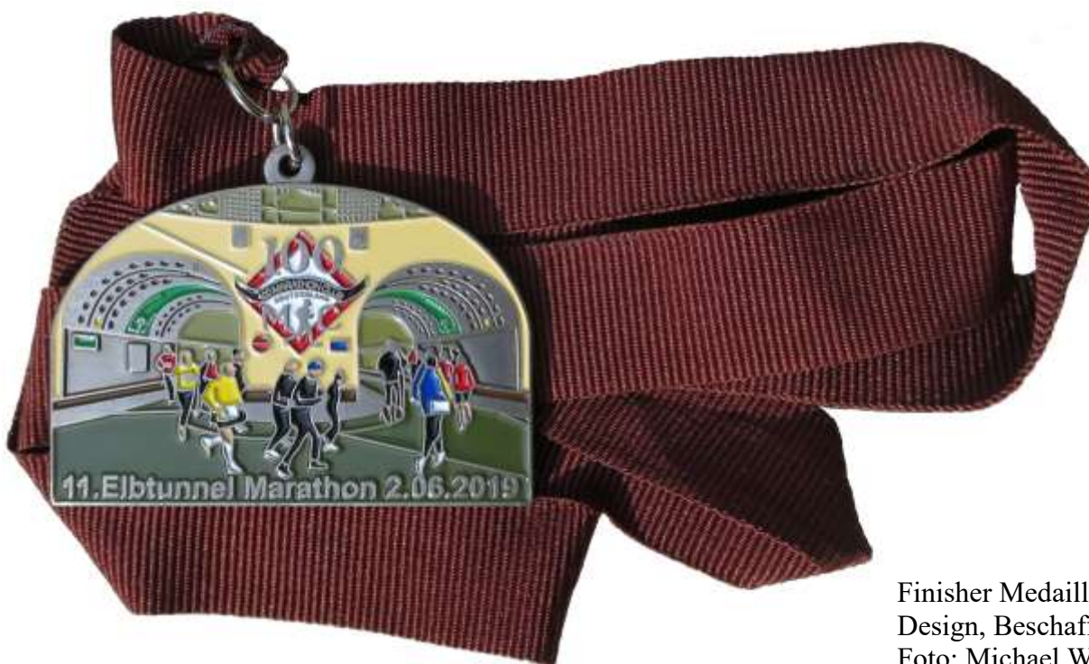
Finisher Medaille Design, Beschaffung und Foto: Michael Weber