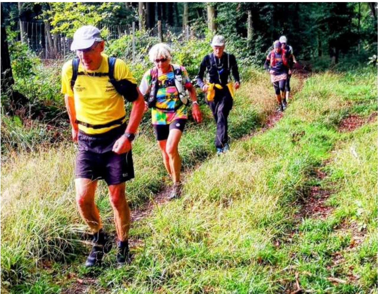
Läufergruppe auf dem Mühlenweg

Läuferinnen und Läufer steigen in ihre Autos und fahren entweder nach Hause oder zum Übernachten nach Wallenhorst.