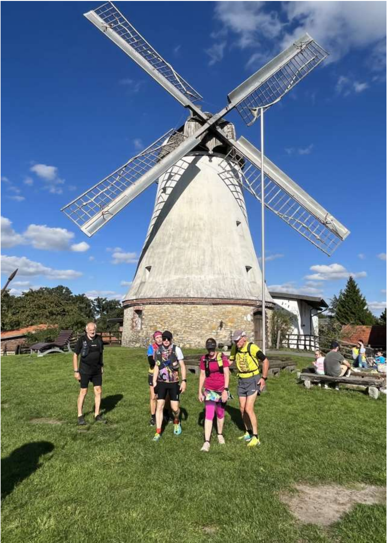
Läufergruppe vor der Lechtinger Mühle in Wallenhorst.