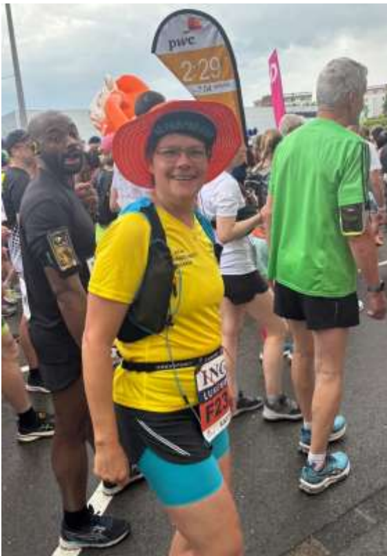
Gut „behütet“ auf dem Weg zur Startlinie kurz nach 19 Uhr

Dann kam der Marathontag, aber er begann sehr ungewohnt. Eigentlich laufe ich gerne früh und liebe Landschafts- und Bergläufe. Nun ein Citylauf und der Start alles andere als früh, nämlich erst um 19.00 Uhr – schließlich handelte es sich ja um einen Nachtmarathon. So konnte man ausschlafen, noch einen kleinen Spaziergang durch die Stadt unternehmen und am Nachmittag damit beginnen, die passende Laufausrüstung zusammenzustellen. Gar nicht so einfach! Verschiedene Teilnehmer