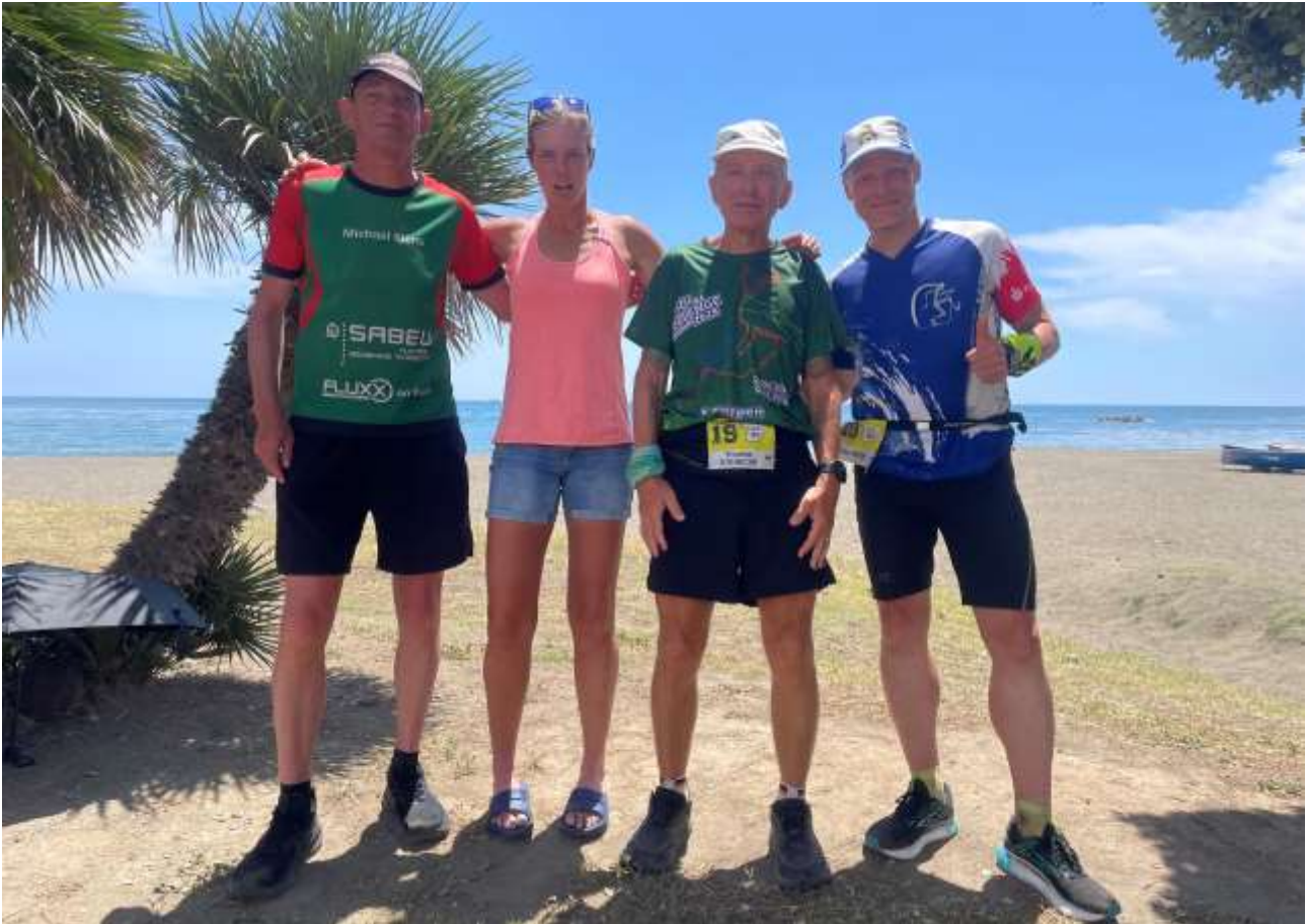
Die Deutschen Finisher

Am Abend fand eine große Abschlussfeier mit festlichem Abendessen statt. Nach dem Frühstück am nächsten Morgen trat dann jeder seine individuelle Heimreise an.