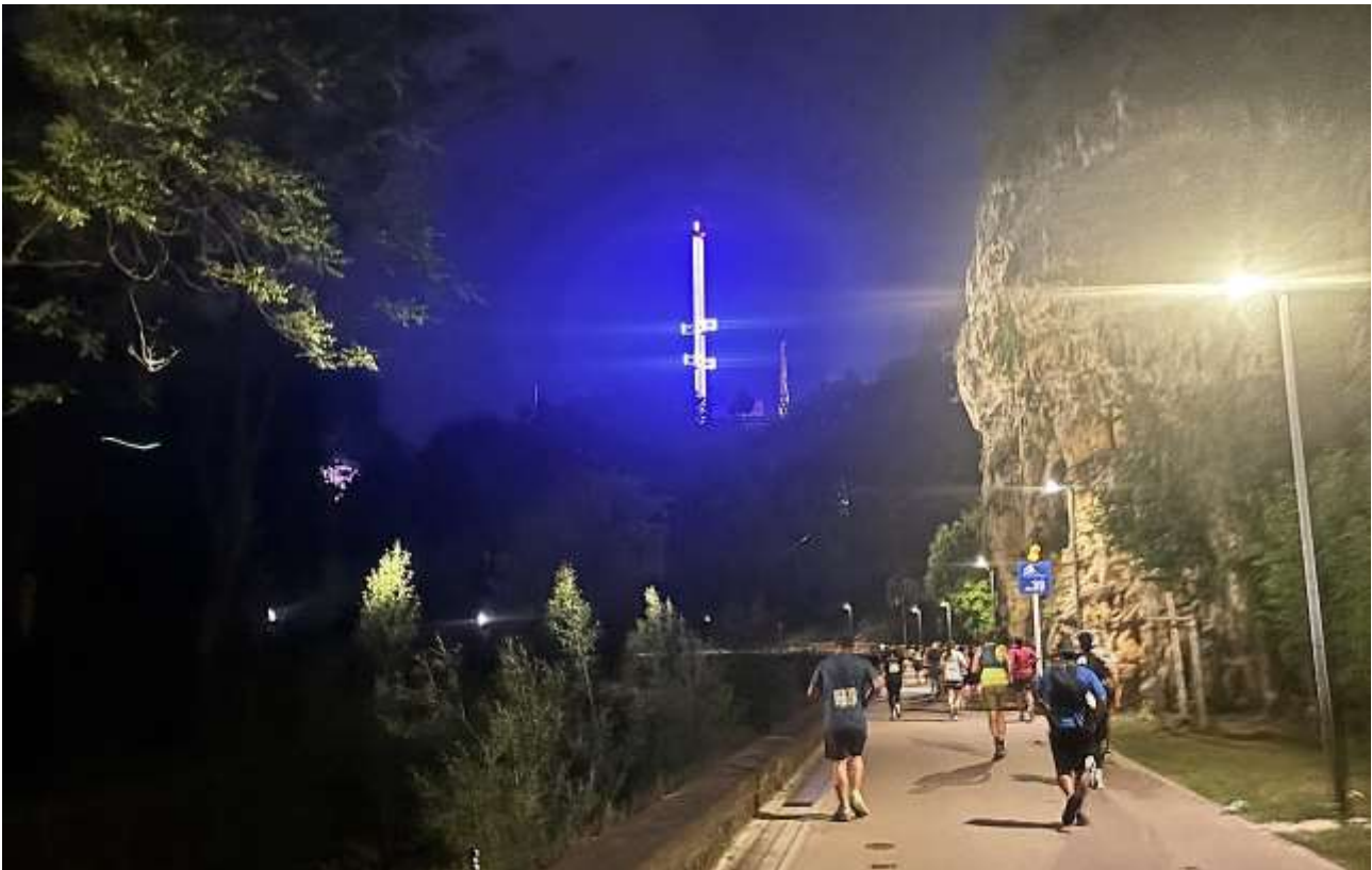
Der wunderbar illuminierte Skylift LOOK, weithin sichtbar aus dem Pétrusse-Tal.

Und gegen Ende eines Marathons war das Bergan schon eine spezielle Herausforderung. In einem weiteren Bogen ging es schließlich doch zum LOOK wo zahlreiche feiernde Zuschauer noch einmal jeden Läufer feierten und sich darin überboten, alle Personen mit Startnummer abzuklatschen.