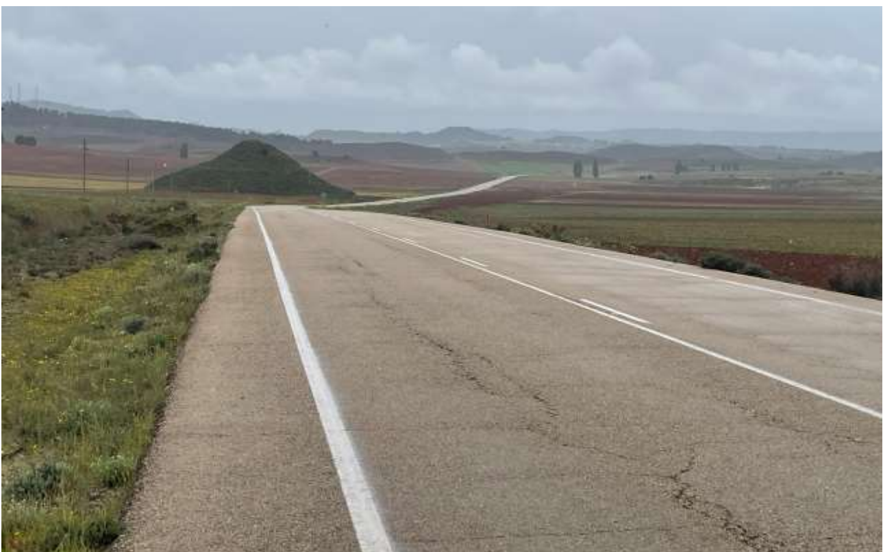
Einsame Straßen ohne Ende

Besonders in der ersten Woche gab es viele Ausfälle: Von den zehn ViAragón-Startern kamen nur drei ins Ziel. Beim TransEspaña war die Quote etwas besser: Von 25 Startern erreichten 13 das Ziel – leider musste auch ein deutscher Teilnehmer aufgeben.