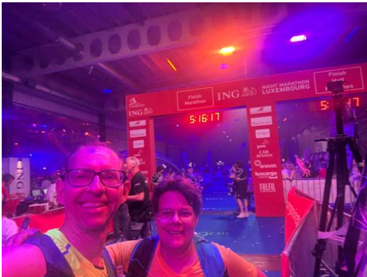
Zieleinlauf in der Expo „The Box“

Was soll man sagen: Luxemburg ist wirklich eine Reise wert! Der Marathon macht Spaß, besonders wegen der durchweg großartigen Stimmung! Bestzeiten sind auf dem verwinkelten und mit 300 Höhenmetern ausgestatteten Kurs eher weniger zu erwarten. Und nach so viel Cityerlebnis findet man mich erst einmal für die nächsten Veranstaltungen wieder mehr bei Landschaftsläufen!